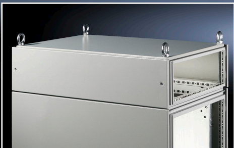
Face inférieure ouverte